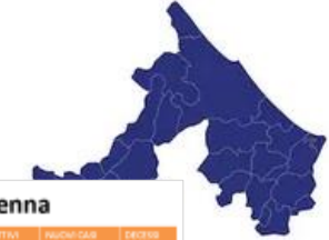
Tabella comuni Rimini