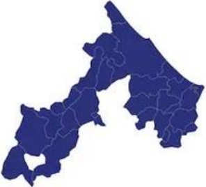
Tabella comuni Rimini