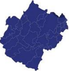
Tabella comuni Cesena