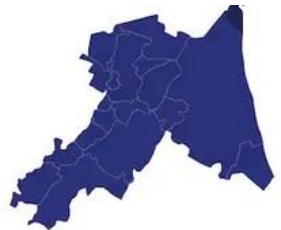
Tabella comuni Ravenna